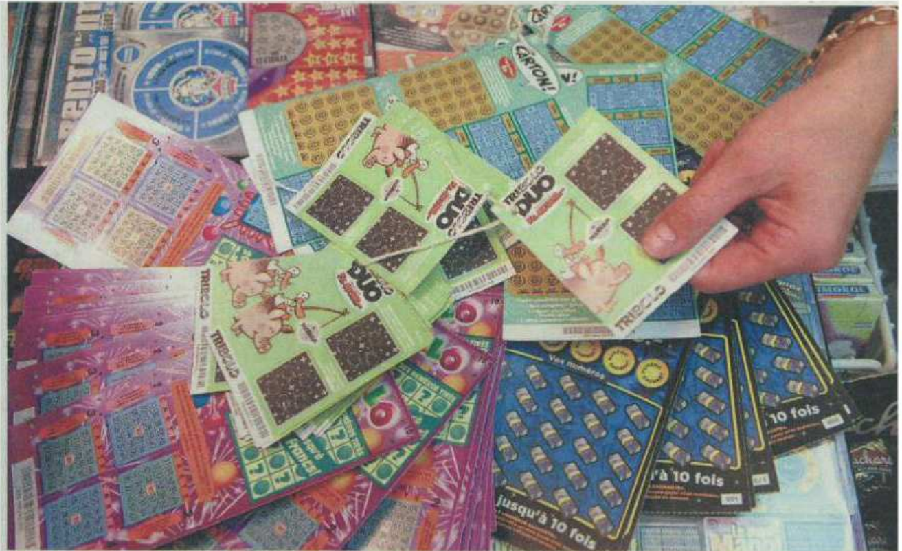
En 2007, pas moins de 2500 bénéficiaires ont profité des dons de La Loterie romande dans le canton.