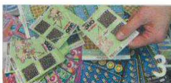
Le Conseil communal prend parti pour la Loterie romande et invite la population à signer son initiative.

→ 05.11.2008 Vivre la Ville [Hebdomadaire officiel d'information de la Ville de Neuchâtel], SIGNEZ L'INITIATIVE SUR LA LOTERIE !, p. 1 & 3