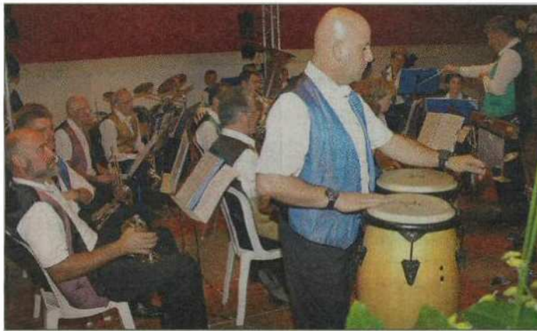
Les productions musicales de l'Harmonie du Bourg ont agrémenté cette soirée inaugurale.